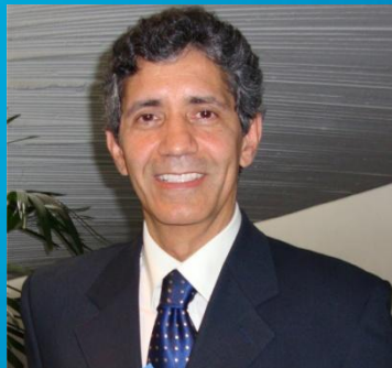
Presidente Fábio Bitencourt